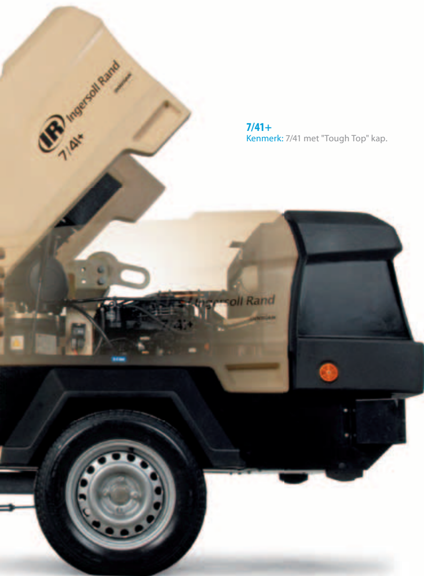
7/41+ Kenmerk: 7/41 met "Tough Top" kap.

De compressoren omvatten een afsluitbare kap en een afsluitbare stalen afdekking voor het instrumentenpaneel . Bovendien vermindert een opklapbare hefbeugel het risico op diefstal door het hefoog binnen de behuizing van de compressor te houden.